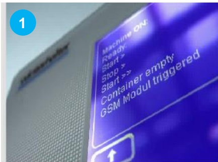
1 L'information est relayée en temps réel grâce à un satellite