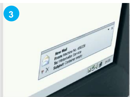
3 Un e-mail ou un SMS vous est directement adressé pour vous avertir de l'erreur